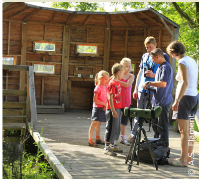
Station d'observation sur la Voie Verte