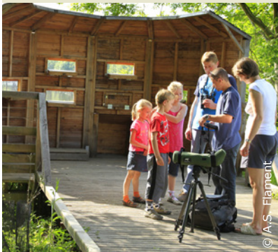
Station d'observation sur la Voie Verte