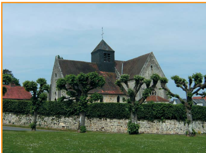
Vue sur l'église Saint-Martin. -Christine Olry-

Arrivée et parking sous les marronniers devant le Chatelet du château rue Saint-Antoine.