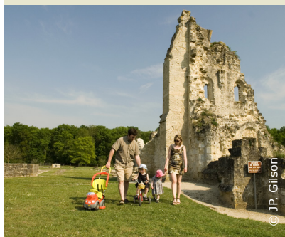
Aux abords des ruines