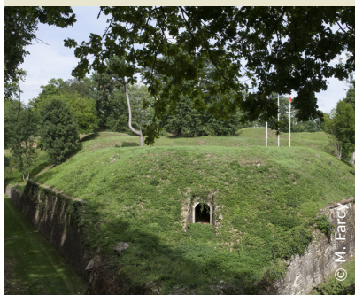
En chemin autour du fort