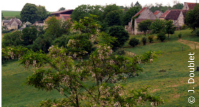
Le village de Tannières