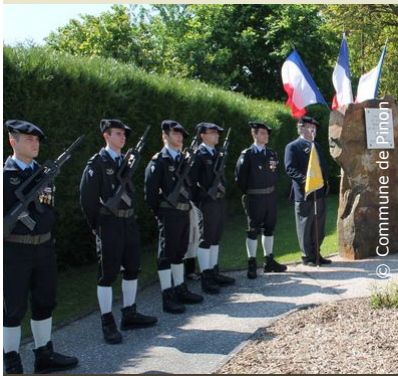
Chasseurs alpins à Pinon