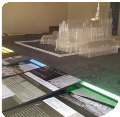
Interpretation Centre of Architecture and Heritage

On the site of the Abbey Saint-Jean-des-Vignes, in the Abbot's house, don't miss the visit of the Interpretation Centre of Architecture and Heritage, featuring a permanent exhibition on the history of the city and the abbey buildings.