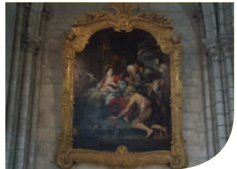
Die Anbetung der Hirten

In den Kapellen des Chorumganges können Sie die Statuen und die reiche Ausstattung des Chores (XVIII. Jahrhundert vom berühmten Bildhauer Michel-Ange Slodtz) bewundern.