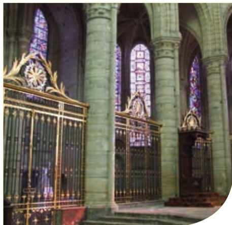
Inside the Cathedral