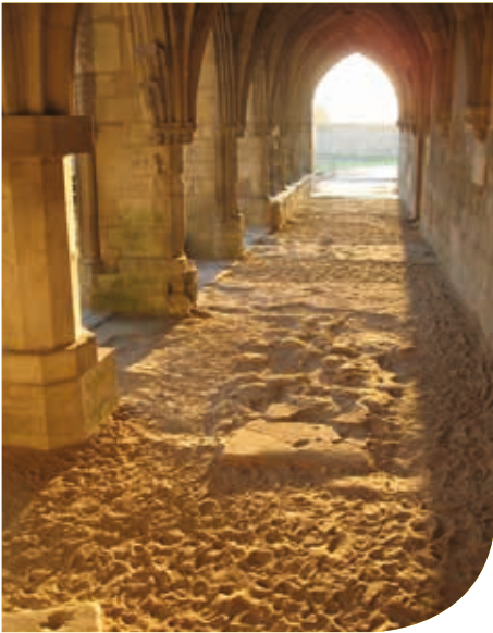
De Abdij Saint-Jean-des-Vignes

Het arsenaal-gebouw biedt u de kans om een kunsttentoonstelling te bezoeken, terwijl het CCEA de archeologische reserves opslaat.