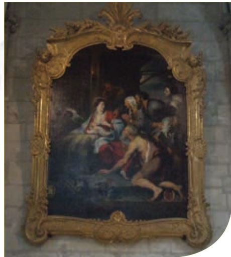
De Schilderij van Rubens

Voor u de kathedraal verlaat, moet u niet vergeten een blik te werpen op de Aanbedding der herders, een schilderij toegeschreven aan het Rubens' atelier, die zich in de noordelijke dwarsbeuk bevindt.