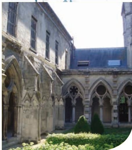
Die Abtei Saint-Léger

Jetzt laden wir Sie ein, nach dem Gemälde « Porträt eines Kindes » mit seinem gehobenen Zeigefinger im Saal für bildende Künste Ausschau zu halten. Zum Abschluss offenbart sich Ihnen die Stadtgeschichte im eigens dafür angelegten Saal.