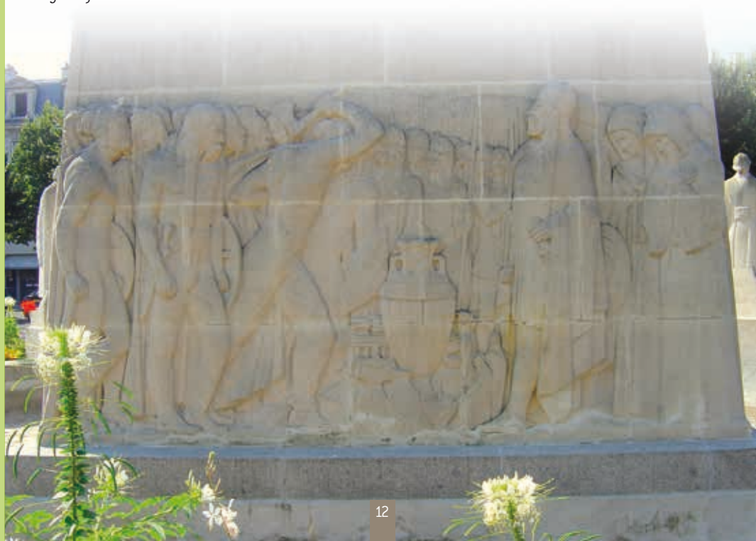
Legend of the vase

Indeed, a famine having strike upon the city, the inhabitants have fled some time. While returning home, they were amazed and delighted to find their seeds transformed in beans. A tasting is a must !