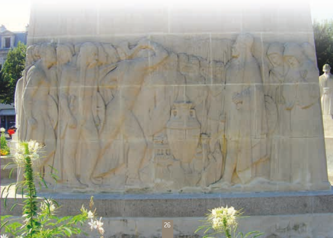
Place Fernand Marquigny

De tweede legende speelde zich af aan het einde van de 19de eeuw : een wachter moet in de toren van de kathedraal de omgeving in de gaten houden. Omdat hij het wat saai vond op die toren besloot hij op een dag in bloembakken wat witte bonen te zaaien . En in september, als zijn droge, witte bonen geoogst werden, deelde hij ze broederlijk uit aan de bevolking van de stad.