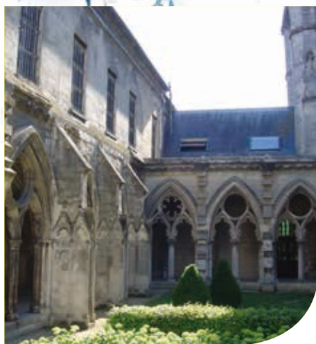
Cloître de Saint-Léger

Nous vous souhaitons ainsi une excellente visite enrichie de véritables découvertes !