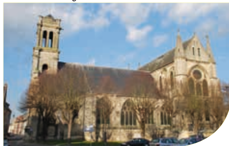
Die Abtei Saint-Léger