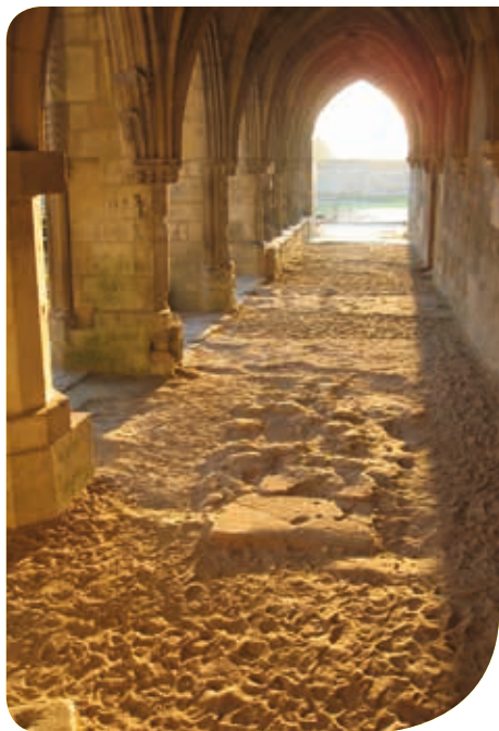
Sunset nearby Saint-Jean

Finally, facing the Arsenal, the Centre of Conservation and Archaeological Studies hides a deep "fault" where huge showcases bring the ancient past of Soissons and the Aisne department to the public's notice.