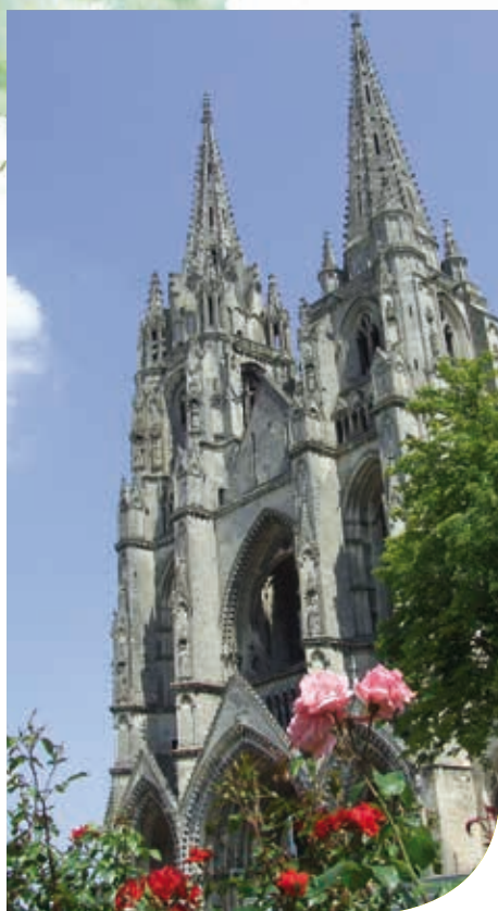
De Abdij Saint-Jean-des-Vignes