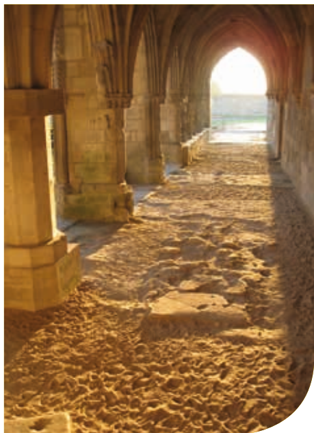
Coucher de soleil autour de Saint-Jean

Enfin, face à l'arsenal, le Centre de Conservation et d'Études Archéologiques cache une profonde faille où d'immenses baies révèlent le passé ancien de Soissons et du département de l'Aisne.