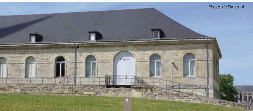
Musée de l'Arsenal