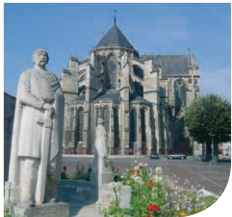
View on the Cathedral

Children will be delighted to discover it, both represented on a fountain, in bas-relief, carved on a pediment or even put in a small niche in a façade, through the streets and alleys of downtown.