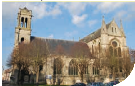
De abdij Saint-Léger