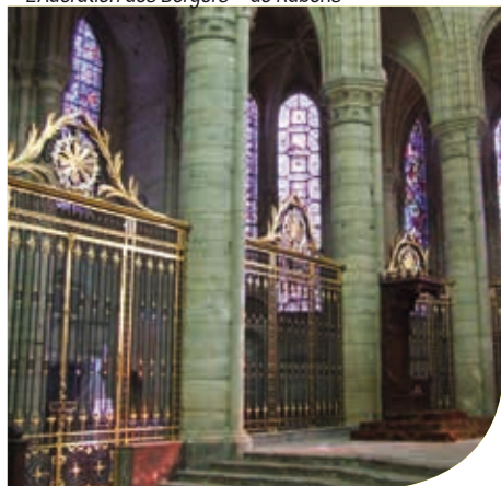
Vitraux de la Cathédrale