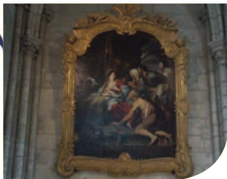
The « Adoration of the Shepherds » by Rubens

A few steps away, admire the statues of the chapels of the ambulatory as well as the decoration of the choir attributed to Michelangelo Slodtz, famous french sculptor of the 18th century.