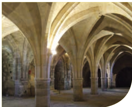
De Abdij Saint-Jean-des-Vignes

Bij zonsondergang kunt u genieten van een mooi tafereel, wanneer de torens van de abdijkerk zich omtoveren in een feëriek beeld.