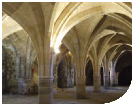
Cellier de Saint-Jean

Cet ensemble monastique d'exception recèle encore un réfectoire, un cellier ainsi qu'un cloître admirables dans le style gothique. Aux beaux jours, les soissonnais aiment se retrouver dans ses jardins pour organiser goûters et pique-niques.