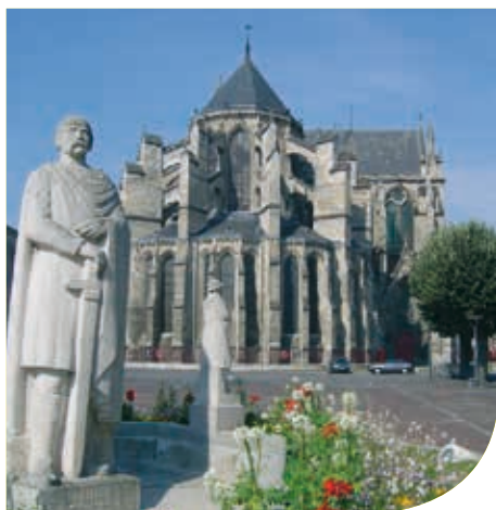
Vue sur le chevet de la Cathédrale St-Gervais St-Protais

Les enfants seront ravis de le découvrir tout à la fois représenté sur une fontaine, en bas-relief, sculpté sur fronton ou bien posé dans une petite niche sur une façade, à travers les rues et ruelles du centre-ville.