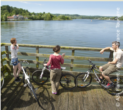
Au bord du Lac de l'Ailette