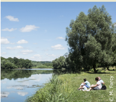
Au bord du Lac de l'Ailette

INFOS TOURISTIQUES : Office de Tourisme du Pays de Laon Tél. 03 23 20 28 62