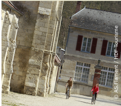
Au pied de l'église de Vorges

INFOS TOURISTIQUES : Office de Tourisme du Pays de Laon Tél. 03 23 20 28 62