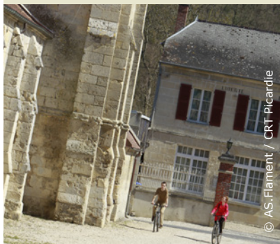
Au pied de l'église de Vorges

INFOS TOURISTIQUES : Office de Tourisme du Pays de Laon Tél. 03 23 20 28 62