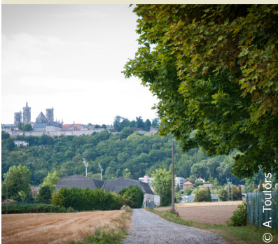
Au pied de la cité médiévale