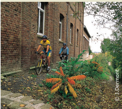
Dans les ruelles de Marle

INFOS TOURISTIQUES : Office de Tourisme du Pays de Laon Tél. 03 23 20 28 62