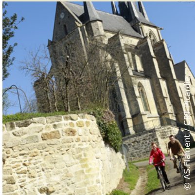
L'église gothique de Royaucourt, aux dimensions spectaculaires

INFOS TOURISTIQUES : Office de Tourisme du Pays de Laon Tél. 03 23 20 28 62