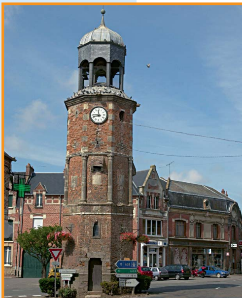
Le beffroi de Crécy. S. Lefebvre-