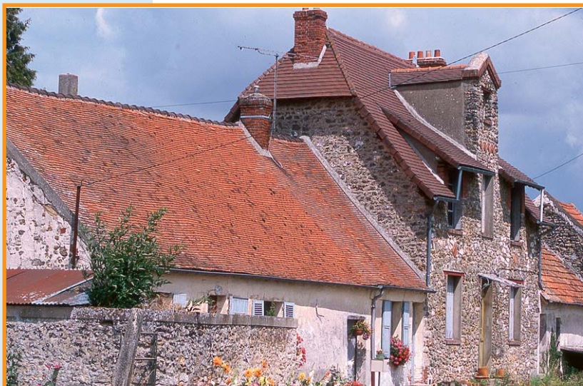
Maison à Seringes-et-Nesles. -A.S. Flament-