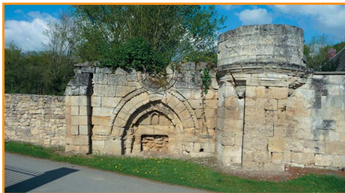
restes du château de Valaverigny : porte obstruée (XIV e siècle). -CDT 02-

Cette courte balade fera la joie des plus jeunes avec la ferme pédagogique et les aquariums de Merlieux. Elle vous permettra également de découvrir les sites majeurs de l'Aisne liés à la nature comme Géodomia (centre de ressources environnementales) ou encore le Centre Permanent d'Initiatives pour l'Environnement.